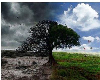
Миколаїв - 2018

За даними дослідження американського Національного інституту здоров'я і професійної безпеки, щорічно більше 35 млн. людей у всьому світі страждають клінічною формою синдрому хронічної втоми.