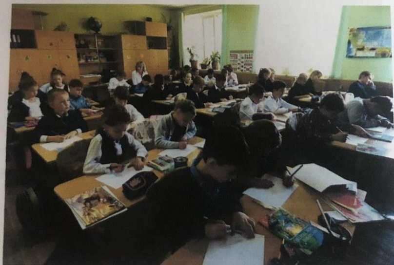
Діти в процесі навчання