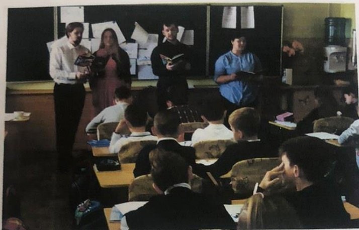
Виховний захід «Країна Музика»