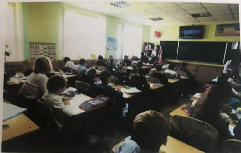
Учні слухають музичний твір